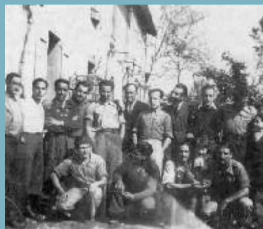
Refugiés espagnols en compagnie d'enfants de Mazères

Tous ces réfugiés quitteront la commune, au début du deuxième semestre 1939 pour rejoindre le camp du Vernet. La briqueterie Carrère a été totalement détruite. Seule trace de cette période encore visible à Mazères, une poutre remise à la municipalité au moment de la démolition, sur laquelle sont gravés quelques noms. Cette unique pièce, souvenir d'un passé douloureux, est exposée au musée de la deuxième guerre mondiale à Maurelle. 2009 est le 70 ème anniversaire de ces événements tragiques.